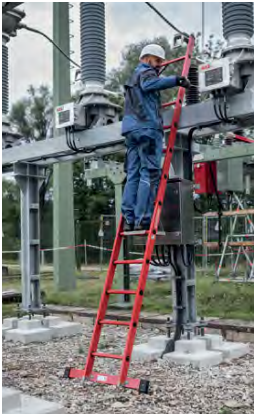
Abb. Bestell-Nr. 36812 mit Bestell-Nr. 19910