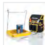
Praktische Helfer 1 Bestell-Nr. 19327