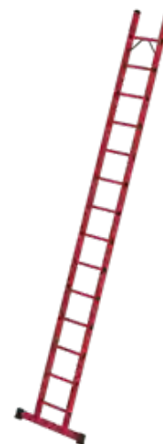
Abb. Bestell-Nr. 36814

mit rutschsicheren Leiterschuh (liegt ab Leiterlänge 3,0 m lose bei)